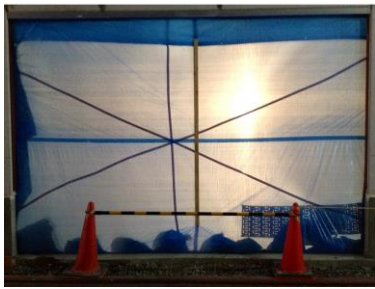
上、横山裕一「世界地図の間」より 2013 下、森千裕「タイトル未定」2014