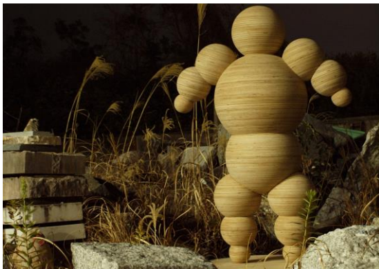
西上翔平 「IC (integrated circle)_1」 2013